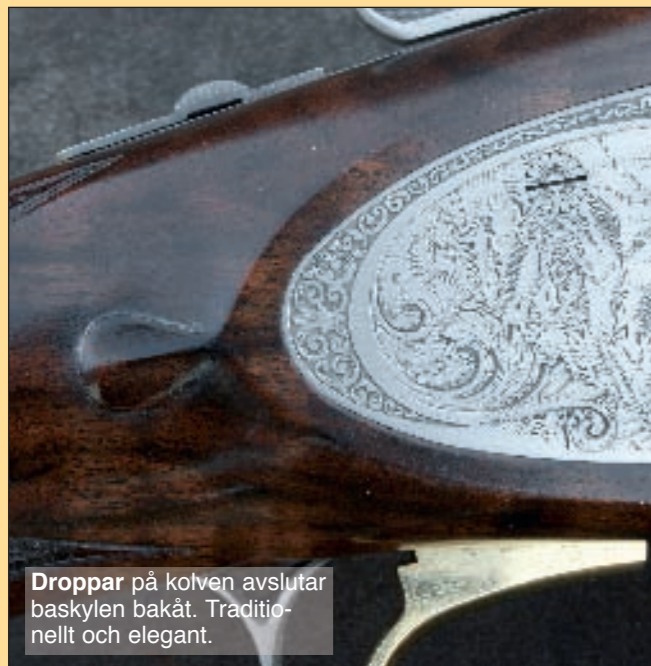
Droppar på kolven avslutar baskylen bakåt. Traditionellt och elegant.