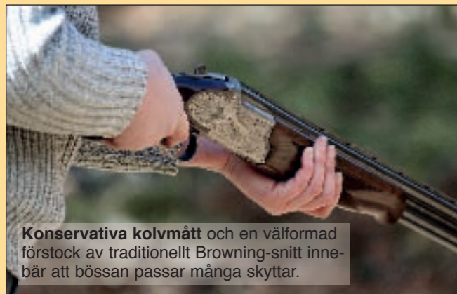
Konservativa kolvmått och en välformad förstock av traditionellt Browning-snitt innebär att bössan passar många skyttar.