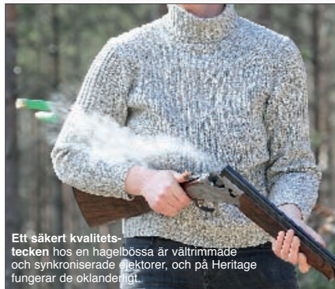
Ett säkert kvalitets-tecken hos en hagelbössa är vältrimmade och synkroniserade ejektorer, och på Heritage fungerar de oklanderligt.

och på 525, vilket innebär att den långa ledbulten, förreglingen och ejektorerna är av samma grundkonstruktion som hängt med ända från B25. Och det är inte dåligt, tvärtom. Brownings förregling är mycket stark och pålitlig.