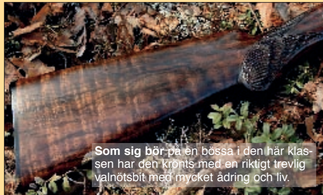
Som sig bör på en bössa i den här klassen har den krönts med en riktigt trevlig valnötsbit med mycket ådring och liv.