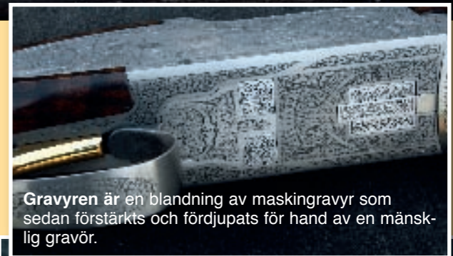
Gravyren är en blandning av maskingravyr som sedan förstärkts och fördjupats för hand av en mänsklig gravör.