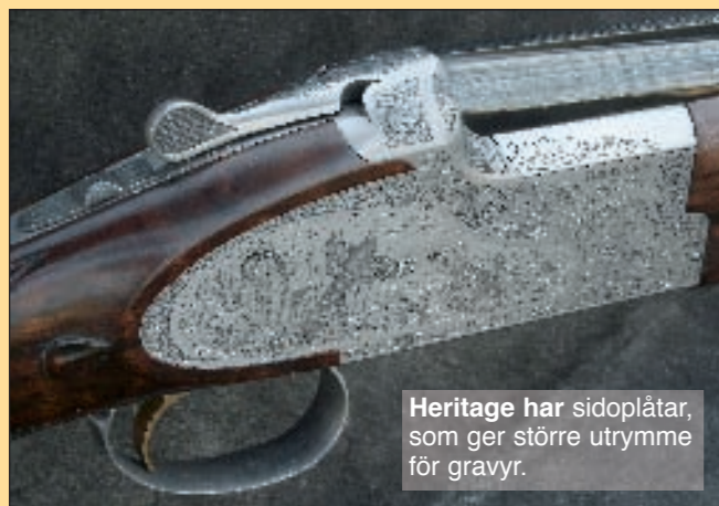
Heritage har sidoplåtar, som ger större utrymme för gravyr.