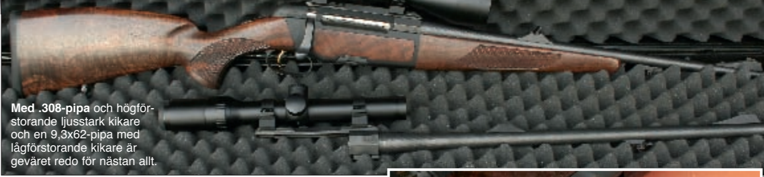
Med .308-pipa och högförstorande ljusstark kikare och en 9,3x62-pipa med lågförstorande kikare är geväret redo för nästan allt.