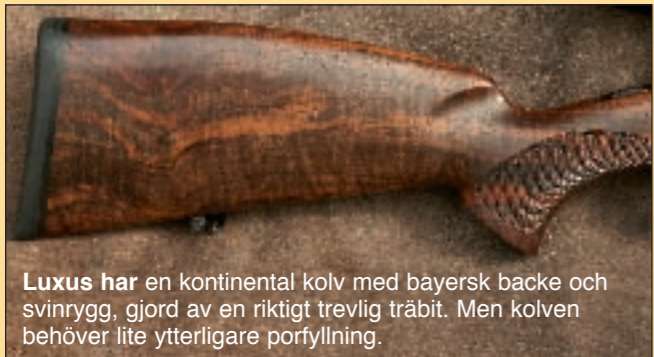
Luxus har en kontinental kolv med bayersk backe och svinrygg, gjord av en riktigt trevlig träbit. Men kolven behöver lite ytterligare porfyllning.