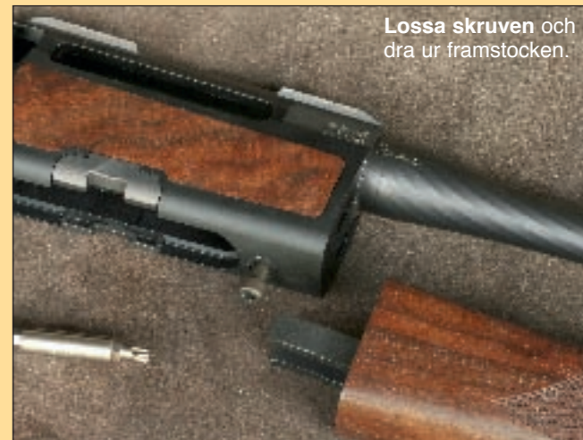
Lossa skruven och dra ur framstocken.