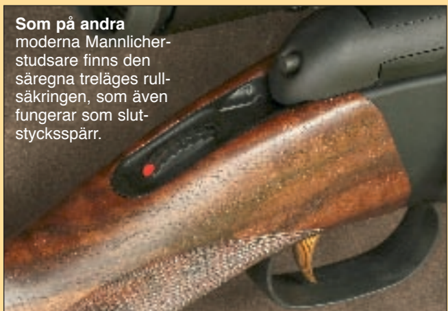
Som på andra moderna Mannlicherstudsare finns den säregna treläges rullsäkringen, som även fungerar som slutstycksspärr.