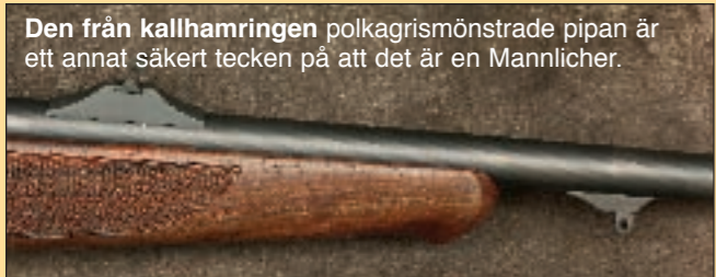
Den från kallhamringen polkagrismönstrade pipan är ett annat säkert tecken på att det är en Mannlicher.