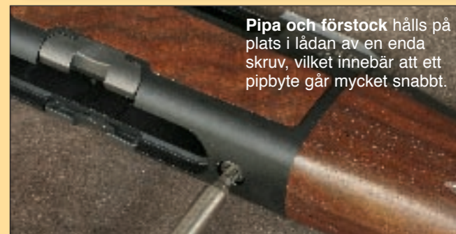
Pipa och förstock hålls på plats i lådan av en enda skruv, vilket innebär att ett pipbyte går mycket snabbt.