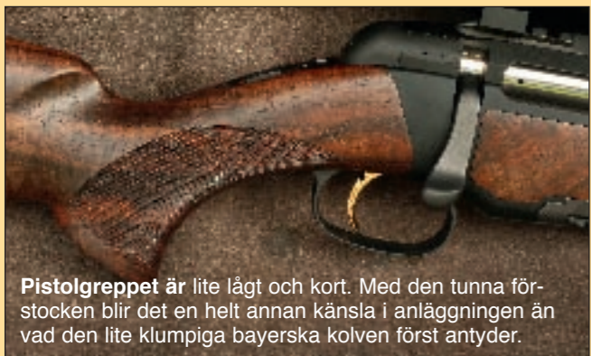
Pistolgreppet är lite lågt och kort. Med den tunna förstocken blir det en helt annan känsla i anläggningen än vad den lite klumpiga bayerska kolven först antyder.