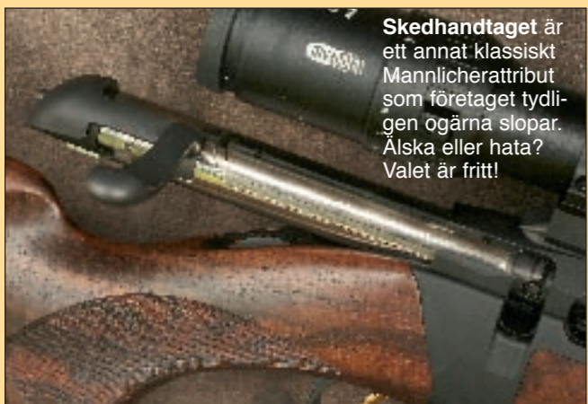
Skedhandtaget är ett annat klassiskt Mannlicherattribut som företaget tydligen ogärna slopar. Ålska eller hata? Valet är fritt!