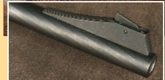
Ett öppet v-sikte och ett stolpkorn ger pluspoäng. Det här är fina öppna riktmedel.

Pipbytet går helt enkelt till så att skruven lossas och förstocken plockas bort, varpå pipan trycks framåt någon millimeter och sedan tippas nedåt som på ett brytvapen.