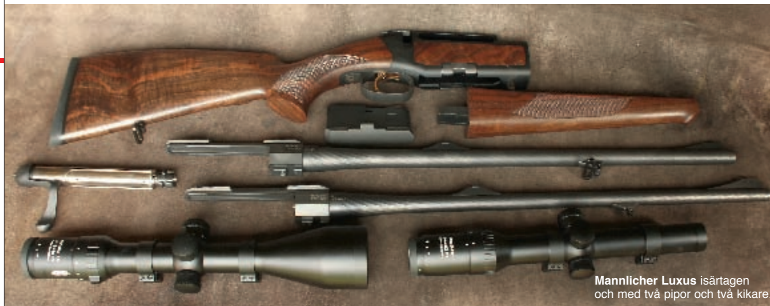
Mannlicher Luxus isärtagen och med två pipor och två kikare.

Förstocken är hög och smal och avslutas med en diskret snabel. Det är traditionellt på alla sätt och vis.