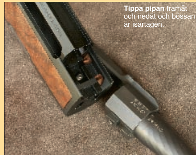
Tippa pipan framåt och nedåt och bössan är isärtagen.